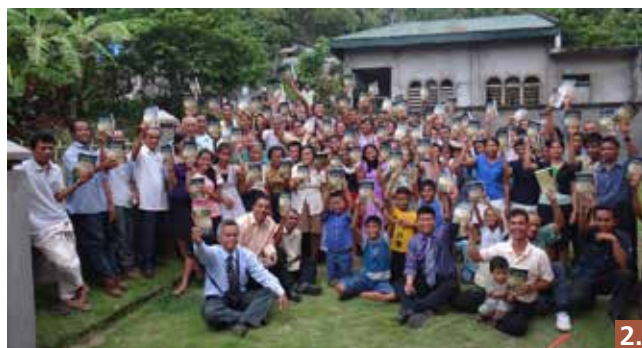
1. Пасторы и литературные евангелисты миссии, участвовавшие в семинаре в Одионгане, Ромблон. 2. Члены церкви адвентистов седьмого дня на острове Бантон держат в своих руках книгу «Великая борьба» и намерены принести ее в каждый дом на острове.