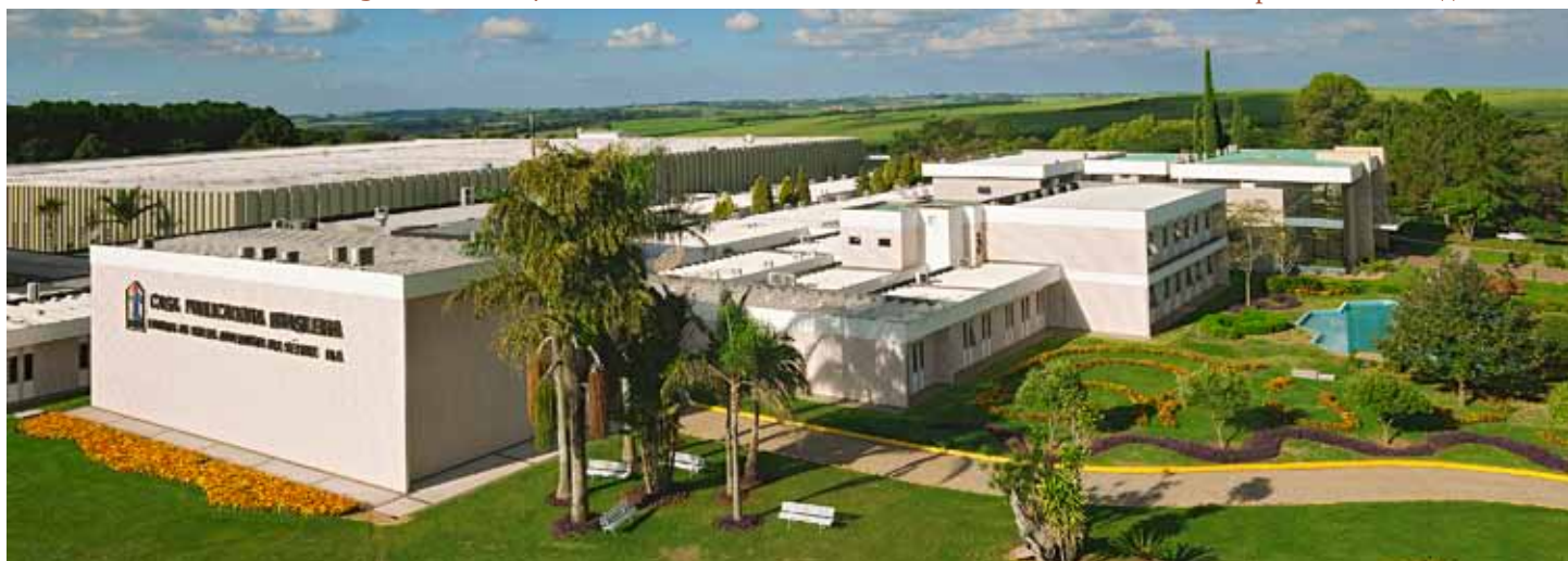
Часть комплекса бразильского издательства