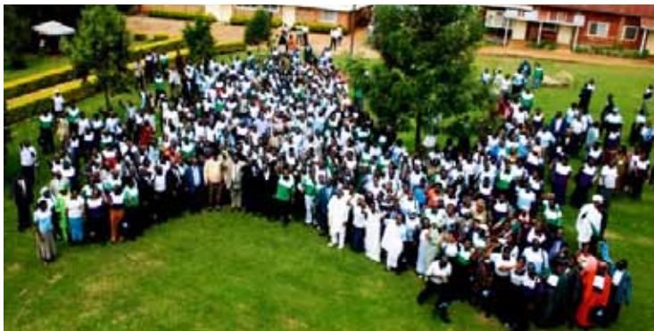
Некоторые из 6,000 литературных евангелистов, совершающих служение в ВЦАД.

Восточный Центрально-Африканский дивизион (ВЦАД) в настоящее время занимает лидирующую позицию по количеству литературных евангелистов (ЛЕ) на полный рабочий день. По милости Божьей программа издательской деятельности ВЦАД постоянно возрастает с 2006 года.