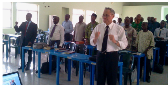
лидеры Северо-Западного униона Нигерии

“Эта программа принесет новый аспект для целостного и систематического роста издательской работы в Северо-Западной унионной миссии Нигерии. До декабря текущего года будут открыты 8 новых точек для АКЦ/ОСС (организация «Служение семье»). В общей сложности планируется открыть 13 таких точек. До ноября текущего года каждая конференция пригласит